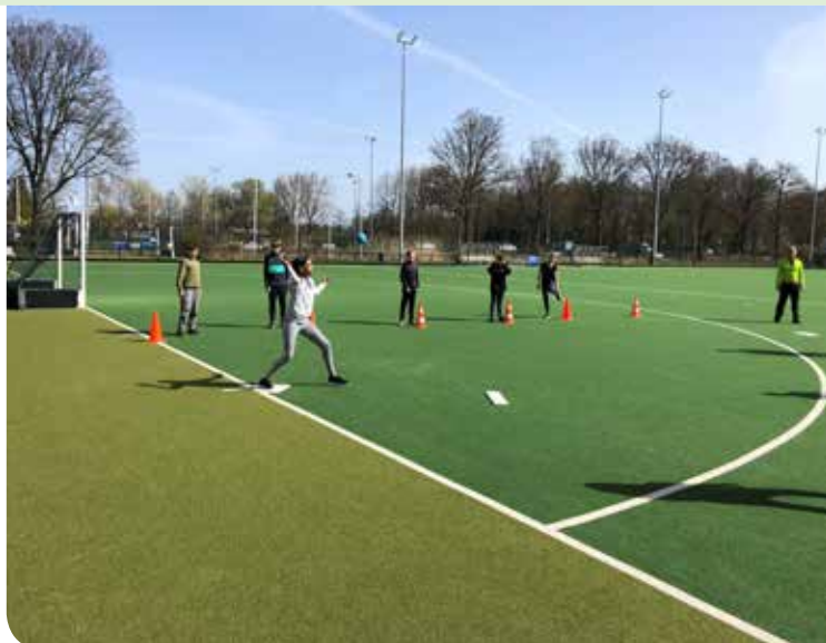
▲ Sla de bal de bal met de hand het speelveld in