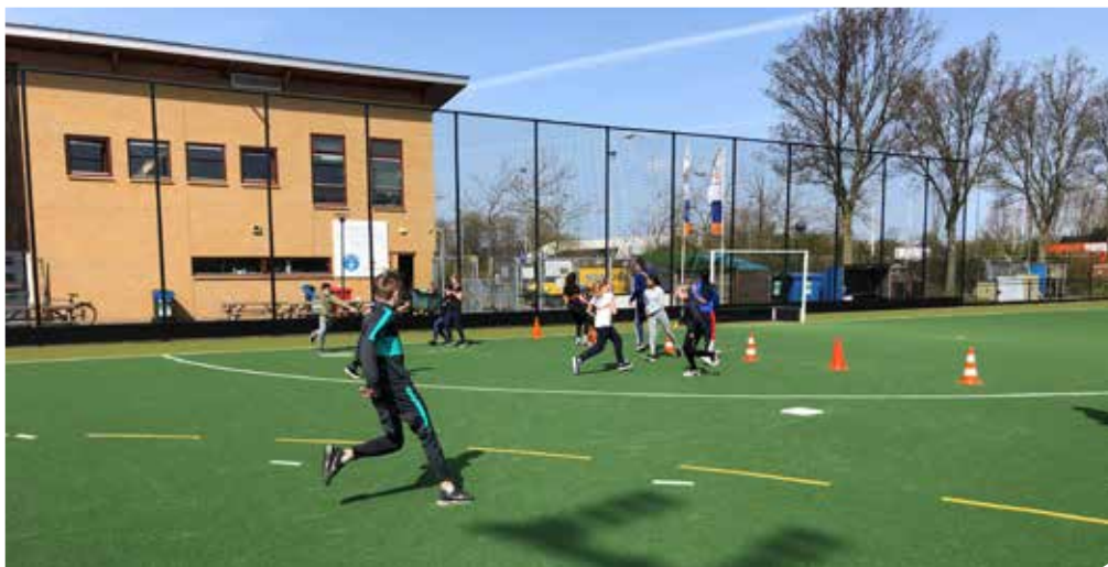
▲ Na de paniekwissel proberen de nieuwe slagpartijspelers veilig een pilon te bereiken

De vaksectie Bewegen & Sport van het Vlietland College in Leiden heeft in coronatijd gezocht naar mogelijke buitenspelactiviteiten en kwam door de '1,5 meter richtlijn' uit op dit nieuwe spelidee.