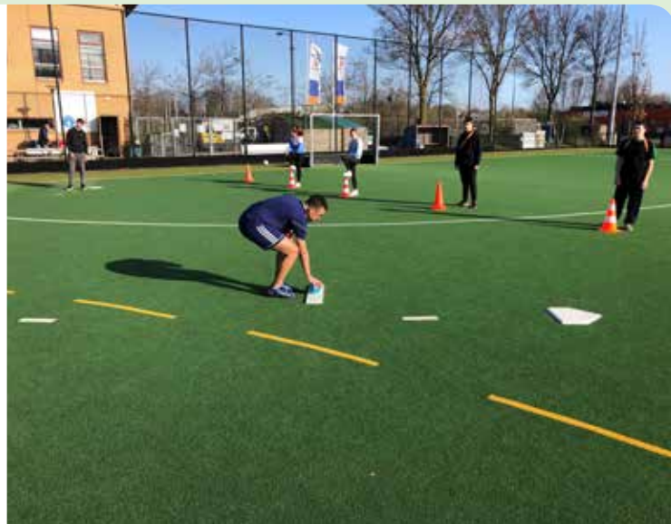
▲ De bal 'virus-vrij' maken

Als een veldspeler de bal door een 'overthrow' in een onbespeelbaar gebied gooit dan mogen de slagpartijspelers één honk verder opschuiven dan waarnaar zij toe op weg waren. Het spel stopt.